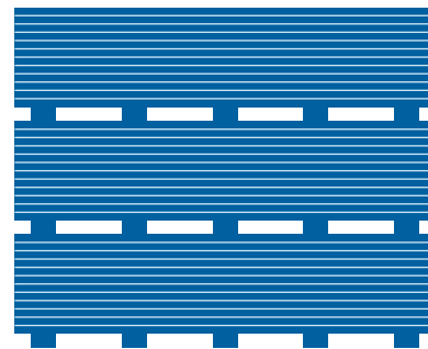
Figura 1: apilado de estibas

Hecho en México por Saint-Gobain Plaka, S.A. de C.V.